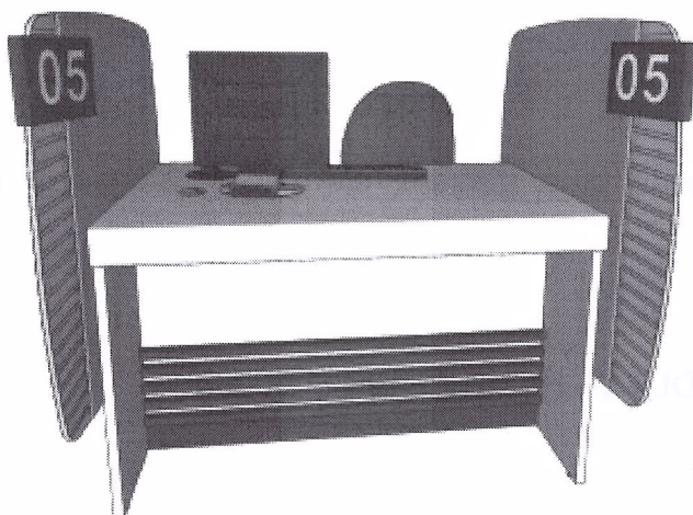
BALCÃO DE RECEPÇÃO. MÓDULO DE TERMINAL- M2

Obs: As cores utilizadas nas imagens de referência são meramente ilustrativas.