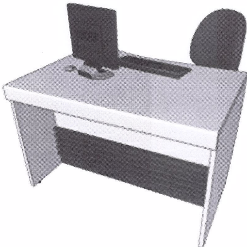
MESA DE ATENDIMENTO INDIVIDUAL – M0