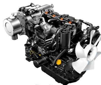
Motores compatíveis com Tier 4 de acordo com a EPA dos EUA

- Acionada por motor diesel marca YANMAR modelo 3TNV88-ZSBV com potência líquida no volante nominal de 27,3HP. Atendendo as normas internacionais de baixas emissões de poluentes EPA ( Environmental Protection Agency ), Tier 4 Interim e da EC ( European Commission ), possui reduzidos níveis de emissões de gases, menor nível de ruído, vibração e proporciona um baixo consumo de combustível, pois o gerenciador YANMAR ajusta automaticamente a injeção de diesel de acordo com o fator de carga da máquina;