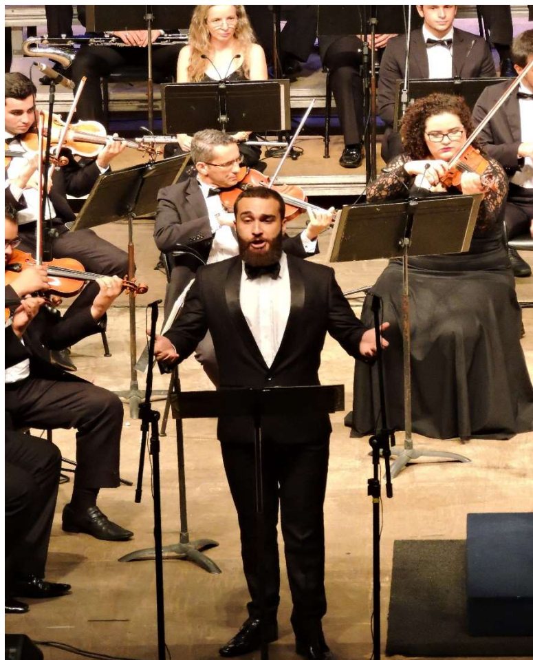
Cantor solista concerto Gala Lírca Teatro Guaíra – OFUC – fevereiro 2017