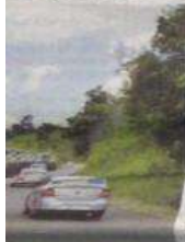
Beltrão em janeiro, mas algumas geológicas no Sudoeste.

ar à exploração do xisto, que é nociva ao meio ambiente.